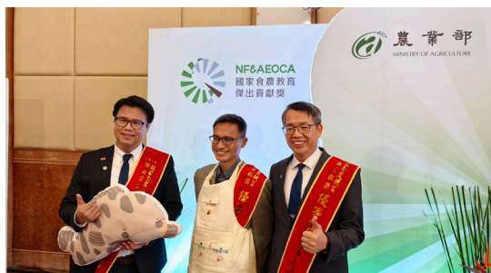
圖 2 「第一屆國家食農教育傑出貢獻獎」 高雄市得獎者

本校推動食農教育的豐碩成果，不僅在校園內發酵，更透過媒體傳播，引起廣泛的社會關注。透過客家電視台、月光山雜誌等媒體的深度報導，生動呈現美濃地區獨特的農業、自然環境、飲食文化等人文風土特色，讓食農教育的理念產生更廣泛的社會共鳴。113 年本校經高雄市農業局評選後特優單位，更代表高雄市參加「第一屆國家食農教育傑出貢獻獎」榮獲全國優選殊榮（如圖 2），並於 114 年初受邀至農業部頒獎典禮進行成果展示（如圖 3），成為推