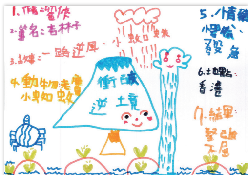
圖 4 學習策略融入語文領域的心智圖