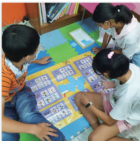
圖 5 不同類型學生的共同操作時間

C. 其他：運用扣條、積木，學習形體、面積；利用採購或致贈的桌遊，訓練區辨反應、知覺動作和社會技巧（參見圖 5）；使用行動載具操作因材網，觀看教學影片和練習題目，多次試誤學習以彌平落差。