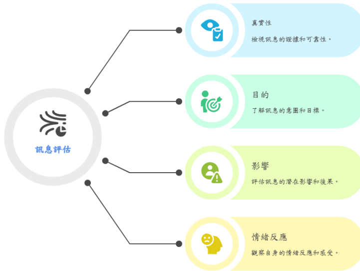
揭開訊息評估的層次